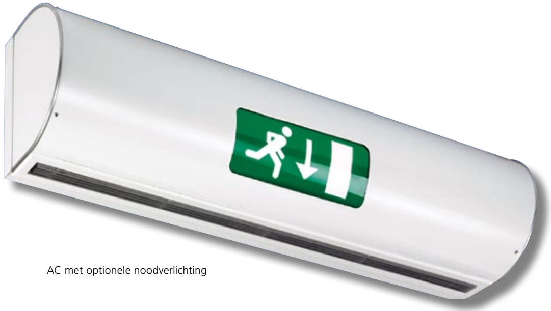
AC met optionele noodverlichting